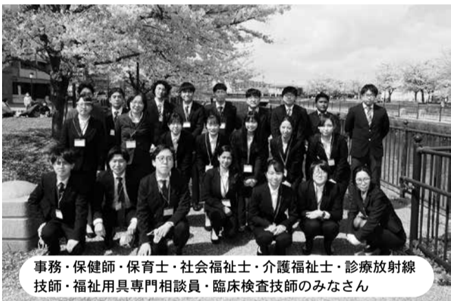
事務・保健師・保育士・社会福祉士・介護福祉士・診療放射線技師・福祉用具専門相談員・臨床検査技師のみなさん