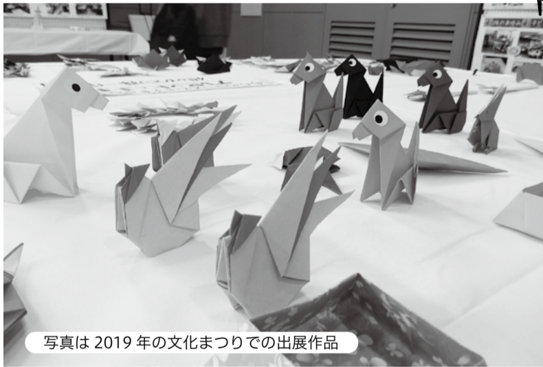
写真は2019年の文化まつりでの展覧作品