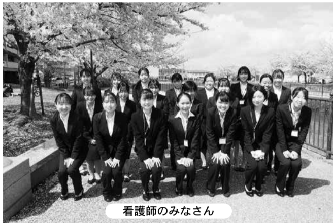
看護師のみなさん