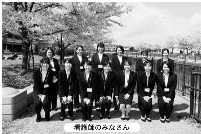
看護師のみなさん