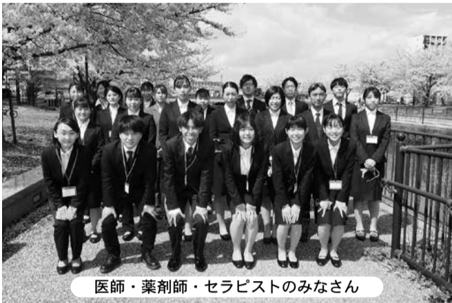
医師・薬剤師・セラピストのみなさん