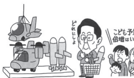
子ども予算倍増はいつ?

ています。ですが、米国の中国に次ぐ世界3位の軍事大国となり、他国を攻撃できる長距離ミサイルを持つことで、周辺国に脅威を与え、相互不信が高まり、軍拡競争を加速させることにつながります。大軍拡を中止すれば、防衛費増税や国債発行といった「財源さがし」は