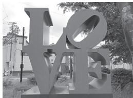
駅前「LOVE」モニュメント

今は千葉県の松戸市に住んでいる。通勤時、京成電鉄の陸橋に、気になる看板を目にする。「千葉へ直通 松戸~千葉所要60分」たった60分なのに、たどり着けない故郷。仕事さぼって、電車で飛び乗り故郷へ向かってみようか。記憶にある街並みを探しに行きたい。