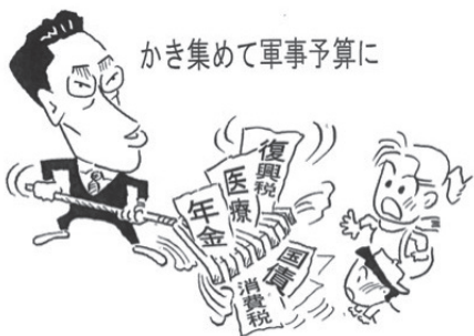
かき集めて軍事予算に

コロナ禍での厳しい状況の中でしたが、職場と友の会の共同で5年ぶりに年間目標500人を見事達成することが出来ました。 みさと健和クリニックの玄関前行動に参加された方、地域訪問行動に参加された方、各事業所の職員の方や地域の方に声をかけをされた方など、皆さま一人一人の行動や取り組みが、なにより大きな力となりました。本当にありがとうございました。 今後とも是非、健和友の会を大いに盛り上げて、「無差別平等」の医療と福祉、「まちづくり運動」を維持発展させましょう。 そして、引き続き、「誰もが安心して暮らせるまちづくり」を合言葉に、職場と友の会との共同の力で、誰でも集えて楽しむことができる「憩いの場づくり」や、「健康づくり活動」、身近な「相談活動」などを通じ、「誰一人取り残さない」地域社会づくりをめざしていきましょう。 (友の会会員拡大推進委員会)