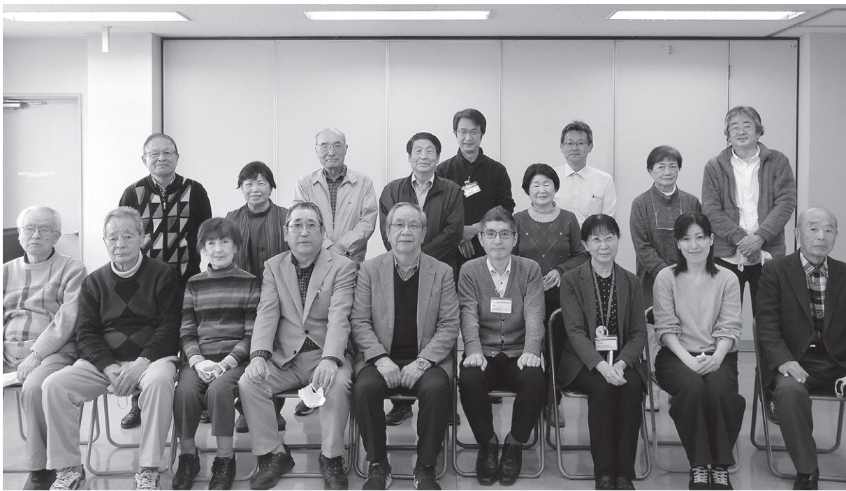
年間目標達成をともに喜び合う拡大推進委員のみなさん

コロナ禍での厳しい状況の中でしたが、職場と友の会の共同で5年ぶりに年間目標500人を見事達成することが出来ました。 みさと健和クリニックの玄関前行動に参加された方、地域訪問行動に参加された方、各事業所の職員の方や地域の方に声をかけをされた方など、皆さま一人一人の行動や取り組みが、なにより大きな力となりました。本当にありがとうございました。 今後とも是非、健和友の会を大いに盛り上げて、「無差別平等」の医療と福祉、「まちづくり運動」を維持発展させましょう。 そして、引き続き、「誰もが安心して暮らせるまちづくり」を合言葉に、職場と友の会との共同の力で、誰でも集えて楽しむことができる「憩いの場づくり」や、「健康づくり活動」、身近な「相談活動」などを通じ、「誰一人取り残さない」地域社会づくりをめざしていきましょう。 (友の会会員拡大推進委員会)