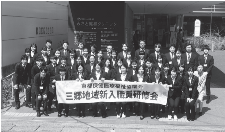
みさと健和クリニック玄関前 三郷地域配属の新入職員の研修会

入職おめでとうございます 4月1日、桜が満開となったおどろプラザで入社式が開かれました。83人の新しい仲間です。新入職員のみなさん、これから一緒に働けることを、私たち職員は心から歓迎いたします。一緒に頑張ってください。 友の会のみなさま、温かくご指導いただけますようよろしくお願い申し上げます。 (編集委員会)