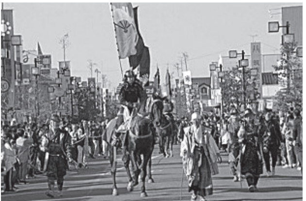
迫力の岩井将門まつり

私のふるさは、茨城県坂東市(旧岩井市)です。都心からは車で60分の距離ですが、水と緑にまつまれた田園都市です。そして1000年以上昔の平安時代に平将門が拠点築いた場所として知られています。毎年11月には「岩井将門まつり」が開催され、迫力のある武者行列が風物詩となっており、市内のみならず市外からも多くの人達がみにくるほどのまつりとなっています。このまつりに合わせて、将門マラソン大会も開催さ