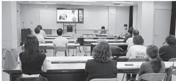
旧みさと健和クリニックにて