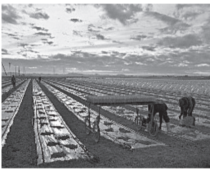
広々とした大地で野菜づくり

又、坂東市は1年を通して穏やかな気候と地下水に恵まれた平坦な地形で野菜作りに適しています。レタス、夏ネギは茨城県の銘柄指定を受けるブランド野菜にもなっており、全国でもトップクラスの生産を誇ります。田舎ではありますが、この地から離れない者も多く、電車が通ってないという難点がありますが、よきふるさとだと思えます。