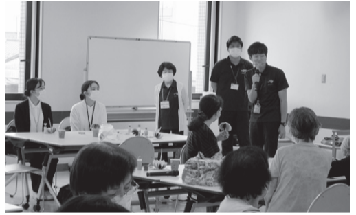
鷹野文化センターにて

鷹野さわやかサロンでは毎月第1火曜日に「健康体操」や「ものづくり」「レクリエーション」など、楽しく行っています。新和や谷中、高州東町や早稲田など、様々な地域から来られて、毎月40人ほどの利用者さんが参加されています。 6月6日のサロンでは、三郷市長寿いきがい課から4名の方々が見学に来られました。この日は、「きよしのズンドコ節」をDVDとCDで練習をしまし た。CDでは1回目の練習でしたが、利用者さんからは「体操の練習が」超やさしい」と申しておりました。その後、休憩をはさんでから「折り紙で雨傘づくり」をしました。10色の傘模様の出来栄はとて綺麗で、利用者さんに喜んで頂きました。この折り紙の雨傘は、友の会の文化まつりに出品する予定です。 健康体操を中心にバリエーション豊富な活動となっており、是非、ご興味のある方はお気軽にご参加ください。 (鷹野さわやかサロン・星野 光子)