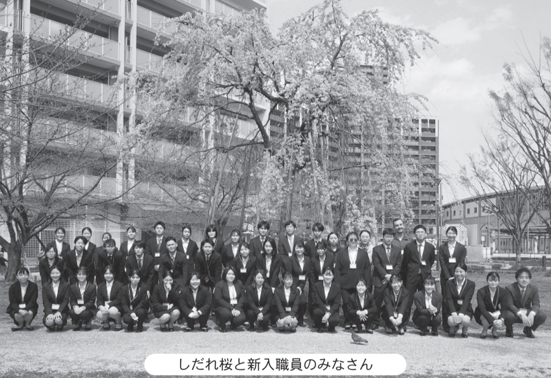
しだれ桜と新入職員のみなさん