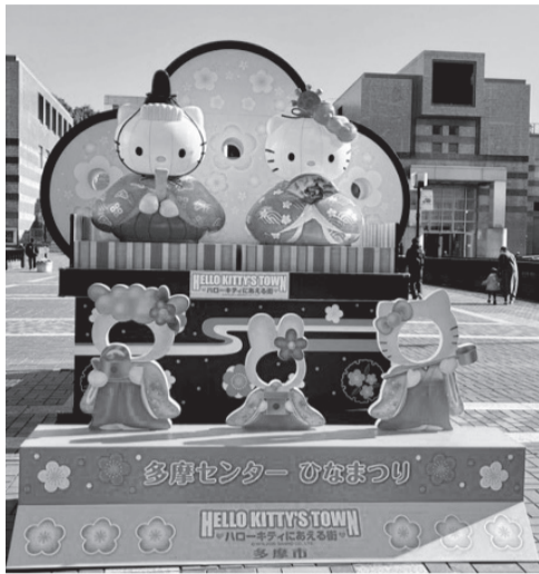
ハローキティにあえる街

多摩丘陵に広がる東京都多摩市、稲城市、八王子市、町田市の4市を舞台に街づくりが行われた「多摩ニュータウン」。その中で「多摩センター」は、私が人生で最も長い時間を過ごした場所です。「多摩センター」駅に降り立てば、傾斜する赤レンガ通り、並木の中に点在する商業施設群、正面に