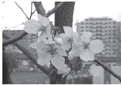
桜の開花便り におどり公園の桜もようやく咲き始めました。4月1日撮影