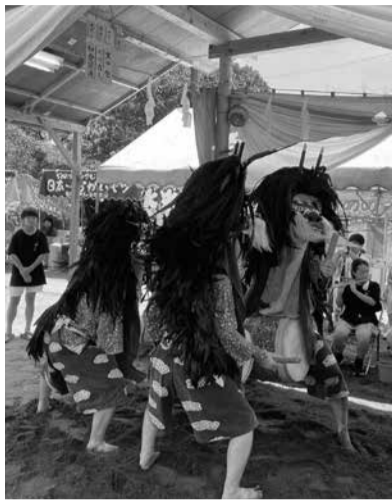
八潮市大瀬の獅子舞

※2025年1月28日、八潮市で道路が陥没する事故が発生しました。原稿は事故前に入稿していただいたものです。(編集委員会)