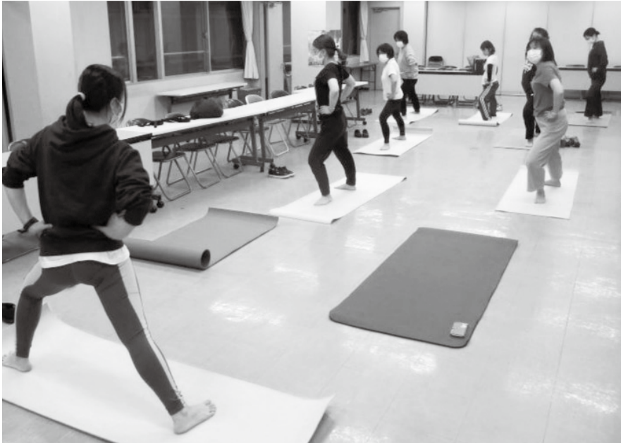
穏やかな動作ですが、体が温まります

発行所 〒341-0035 三郷市鷹野4-494-1 「健康のひろば」編集委員会 Tel. 048-955-7872 Fax. 048-955-7897 E-mail tomonokai-m@kenwa.or.jp http://misato.kenwa.or.jp (毎月25日発行 定価1部30円)