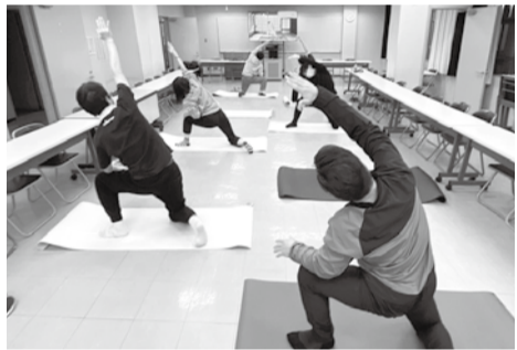
るヨガサークルを目指してまいります。(HPH推進委員会)