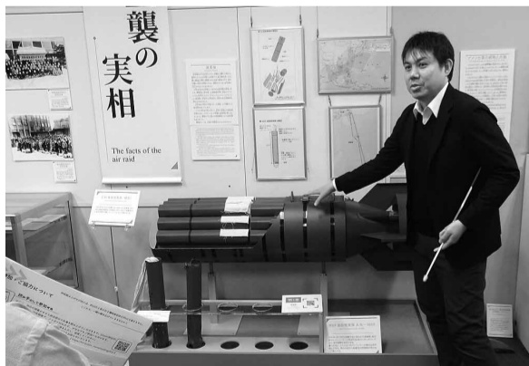
東京を焼け野原にした焼夷弾

3月10日の夜中、大規模な空襲を受けどこに逃げれば助かるなど全く分からない状態で、あちらこちらを逃げまどい、ほんの少し避難する時間、場所が違うだけで生死を分けた恐ろしい一晩の体験談は、リアルに戦争の恐ろしいものだ私たちの頭に刻み込むのに十分すぎるお話をしました。また、資料館に展示されていた写真では、東京が一面焼