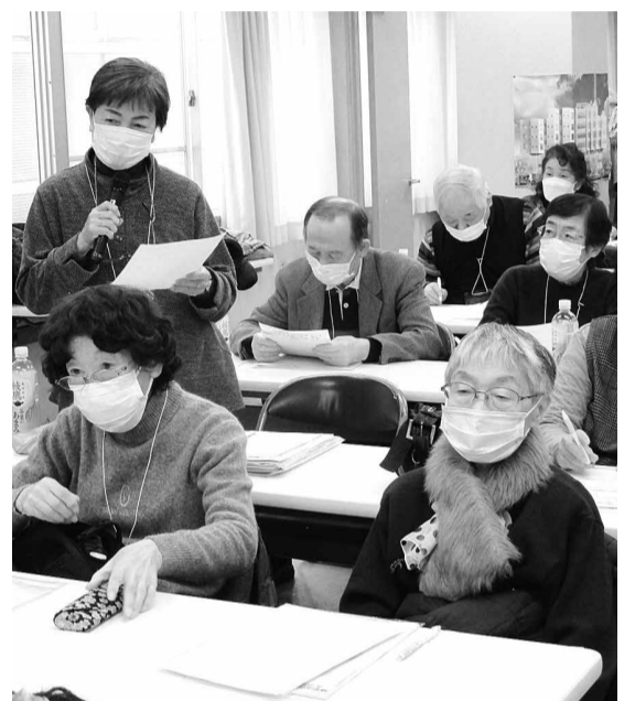
日頃の活動内容を報告

これからの友の会活動を発展させ各支部ブロックの経験を深めるために1月18日に「友の会活動交流集会」を開催しました。