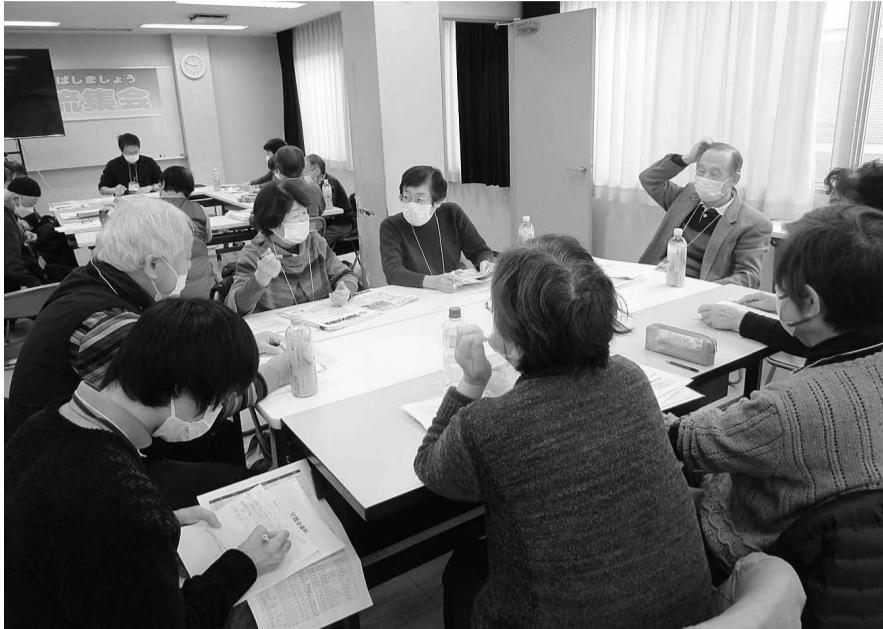
楽しく交流できました

発行所 〒341-0035 三郷市鷹野4-494-1 「健康のひろば」編集委員会 Tel. 048-955-7872 Fax. 048-955-7897 E-mail tomonokai-m@kenwa.or.jp http://misato.kenwa.or.jp (毎月25日発行 定価1部30円)