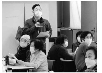
セラピストのアドバイス

参加者は43名で、福祉協同サービズから3名、みさと健和クリニックリハビリから1名、健和友の会事務局から2名、三多摩健康友の会5名（見学）の方々の協力を得まして、実施いたしました。午前10時より始めまして、前半30分はトルト測定会で、後半30分トルトの結果返しとその説明を行いました。トルト測定機3台を使用し、速度・リズム・ふらつき・左右差を点数で表します。満