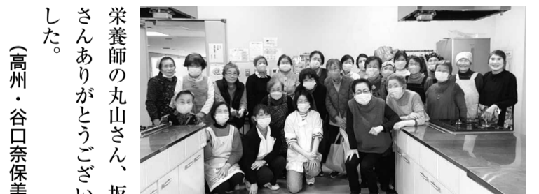
みんなで集合写真

方々とも楽しくお話しつつ、でも手はテキパキと動かし、隠し味やアドバイスをいただけてとても参考になりました。