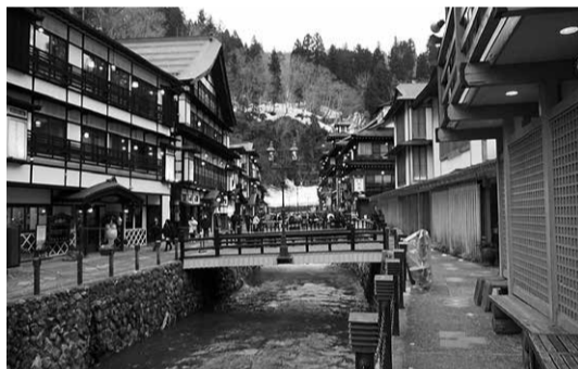
山形県銀山温泉の風景