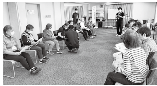
説明を聞いているところ

で歩いてみようかななんて笑って帰りました。20名の参加でしたが次回ももっとたくさんの方に活動を知ってもらえるようにできればいいなと思