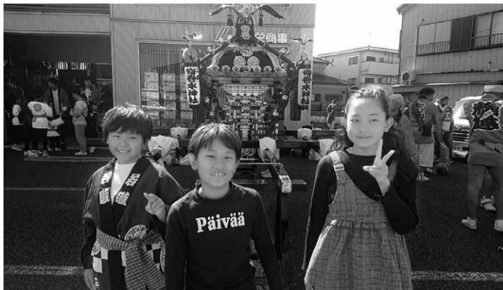
子どもたちと神輿