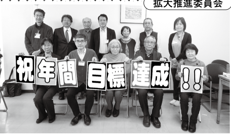
4/2友の会 3役会議前に撮影