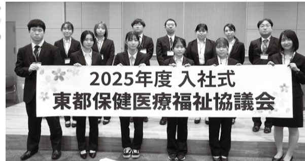
新入職員のみなさん

東都協議会は1951年に小さな診療所から始まったときから地域の私たちの病気を支えてきた。私たちが暮らした。私たちの理念である「病気の障がいを持ってもらえない人らしく住み続けられる地域づくり」の実践のためにはすべての職種が地域住民の健康を守るために知恵を出し合い、成長することが大切です。