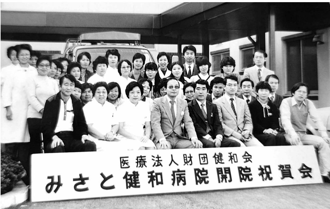
医療法人財団健和会 みさと健和病院開院祝賀会

翌朝は休日である。医療体制が不十分で、結果が悪ければ最悪。万 one のためにと事前に調べてあった比較的近い群馬民医連、前橋協立病院に電話した。すぐ準備して、必要なら手術にも対応してくれるという。救急車に一人で付添い同乗して山を下るとき、腹痛は悪化してゆき、時間を長く感じた。病院に到着すると、当直の外科医も虫垂炎間違いなし、と同じ診断で、すぐに緊急手術になった。手術は無事に成功。切除された、赤黒く腫れあがり炎症の進んだ虫垂を見てほっと息をついた。手遅れになり虫垂が破れれば、腹膜炎を合併して重症化するリスクもあったのだ。休日でも迅速に適切な対応してくれた、頼もしい民医連の仲間、前橋協立病院に大いに感謝したものだ。