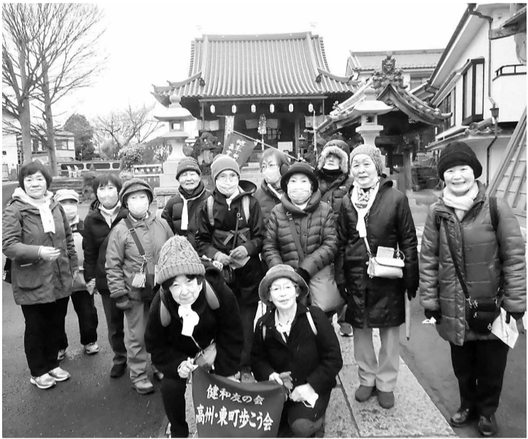
1 番目のお寺の成就院(じょうじゅいん)で撮影

年初めの歩こう会、朝雪が舞い今日の歩こう会はどうしようかと副世話人代表と相談して、決行しましょうとのアドバイ 三郷市七福神めぐりは