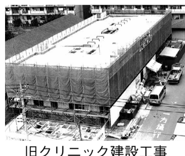
旧クリニック建設工事

85床の小さな病院が一気に飛躍拡大し、人材募集も簡単ではない。開院後は全職員が超多忙、大変な苦勞であった。私も、副院長として外来の中心で、45床の老人病棟も一人で担い、夜は地域の小