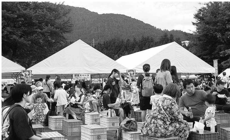
夏まつり「山ノ内うどん」

「うどん」が始まり、今年で50年、今までに賑やかでした。温泉に入る猿が目当ての外国人観光客も年々増え、ツアー客も来るようになりました。