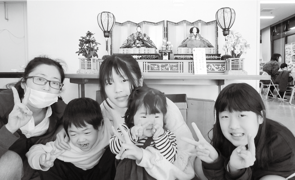
当日参加されたご家族のみなさん

発行所 〒341-0035 三郷市鷹野4-494-1 「健康のひろば」編集委員会 Tel.048-955-7872 Fax.048-955-7897 E-mail tomonokai-m@kenwa.or.jp http://misato.kenwa.or.jp (毎月25日発行 定価1部30円)