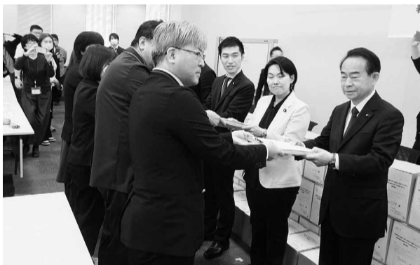
国会議員に署名を手渡す

取り組みが共有され、多くの人の声を集める重要性を改めて感じました。議員訪問ではグループで5件を回り、多くは秘書の方の対応となりましたが、議員本人にお会いすることもできました。初めての参加で緊張もありましたが、医療機関の厳しい状況を、直接伝えることができ、貴重な経験となりました。 今回の取り組みを通して、現場の声を社会の課題として示し、制度の見直しや支援につなげていくことが、政治や社会を動かす力になると実感しました。地域住民が安心して医療を受け続けられる環境と、職員が安心して働くことができる環境を守るため、今後もこうした取り組みに関わっていきたくと考えています。