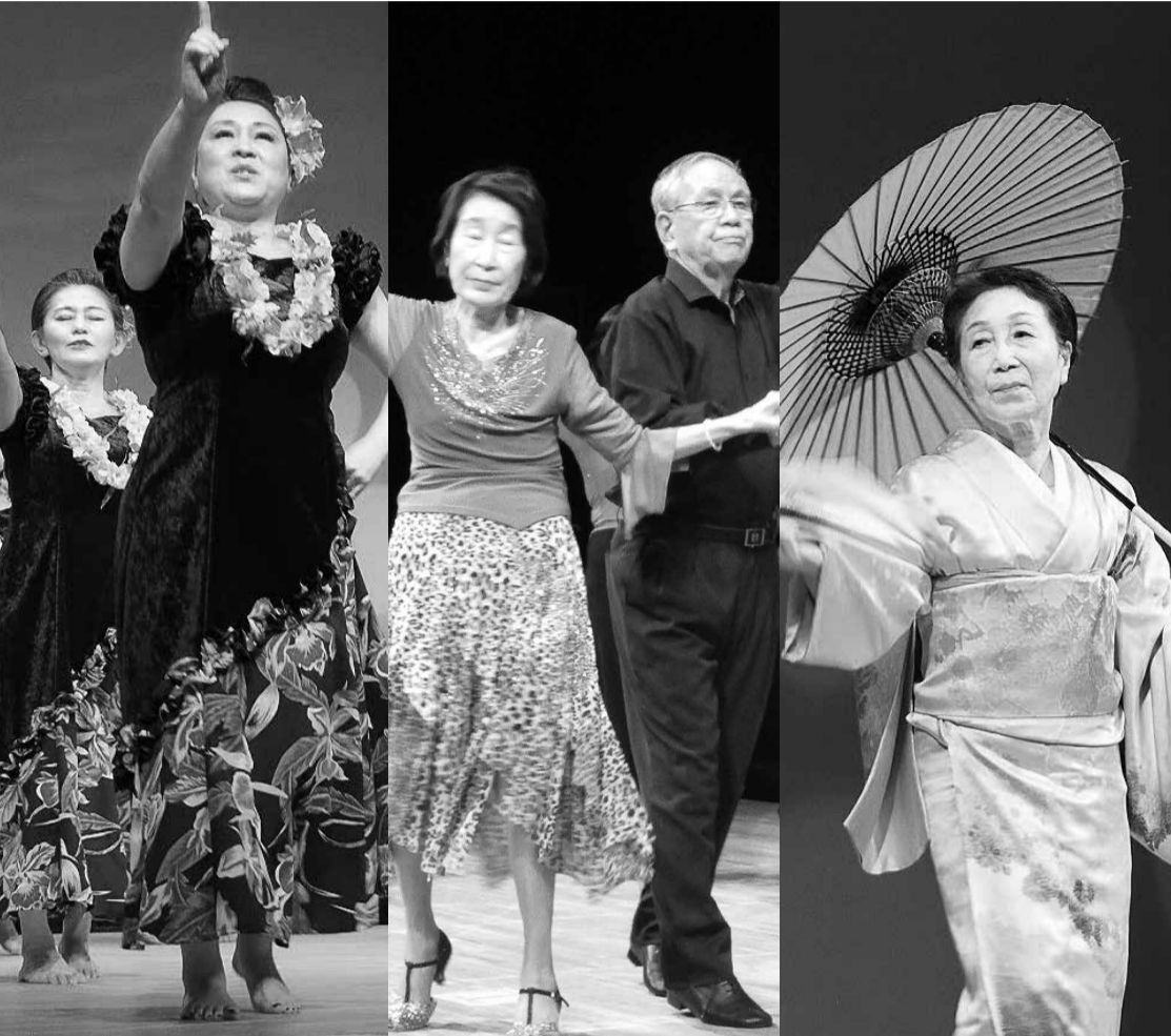
お子さんから大ベテランまで生き生きと表現しました

の方の演技が生き生きと素晴らしく表現されていと思います。初参加の津軽三味線やクラシックからジャズ、ポピュラーまで組み込んだピアノ演奏に、アンコールの拍手が沸き起こりました。