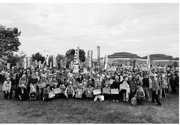
未来は若者たちの手に(5・3憲法集会)

参院選大敗の立て直しの役者として高市政権を誕生させた自民党は、高市の右翼的持論を徹底して隠して、国会論戦も飛ばして選挙に突入させ、立憲の弱腰から生じた「中道」誕生の隙をついて、自民単独で衆院3分の2を超える大勝を掠め取りました。更に、改憲政党・維新を取り込んだ体制を敷き、戦争のできる国作りに駒を動かして始めているのが、今の局面です。中国脅威論を吹聴して、安保3文書の前倒しで防衛費倍増の予算を通した高市総理は、殺傷兵器輸出までも解禁して防衛