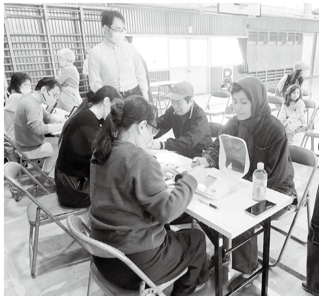
健康への願いはみんな同じ

三郷市国際交流協会が主催する「外国人×日本人交流イベント」において、三郷団地周辺には