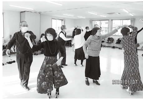
練習の日がくるのが楽しみに

たぶんに漏れず高齢化がすすんでいます。この練習日があるのを楽しみにしている人もいます。もう少し続けようかと思っています。練習が月に1回なので、なかなか覚えられず、どうしても忘れてしまうこともあり、苦勞しています。月謝は3か月1500円です。どなたか入会してくれる人がいないかなあと、心待ちにしています。