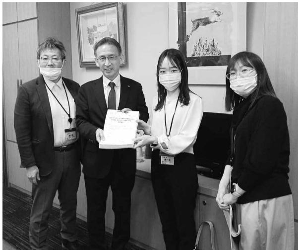
「医療機関の維持存続への支援を 求める署名」84万筆を提出

4月8日、国会議員要請行動に参加し「医療機関の維持存続への支援」を求める署名の提出と要請を行いました。全国から約84万筆の署名が寄せられ、課題への関心の高さと切実さを実感しました。署名に込められた思いを受け、現場の実情や課題を伝え、支援の必要性を訴えました。 当日は全国の民医連から160人以上が参加しました。各地での署名の